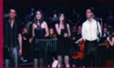
KENT ORKESTRASININ 4 SOLİSTİ KONSER SIRASINDA