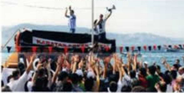
KABATAŞLI BEŞİKTAŞLILAR DERNEĞİ MENSUPLARI DA PİLAVA ÖZEL TEKNE İLE GELDİLER.