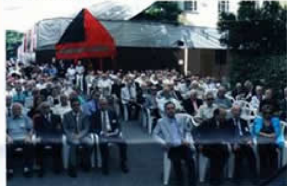
PILAV GÜNÜNE KATILAN PROTOKOL TÖRENDE BİRARADA...