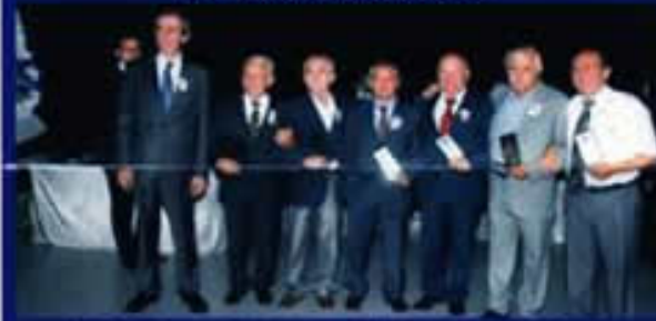
1970 MEZUNLARI PLAKETLERİNİ ALDIKTAN SONRA ARKADAŞLARI İLE BOL BOL RESİM ÇEKTİRDİLER