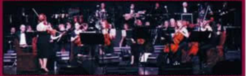
İ.B.B. KENT ORKESTRASI AKATLAR MUSTAFA KEMAL KÜLTÜR MERKEZİ SAHNESİ'NDE...

Unutamadıklarımızdır... Yaşadığımız bu sıkıntılı günlerde, bir tatlı hüzdür... Bir tatlı nostaljidir..." Bu nostalji, bu keyif, için kendimizi