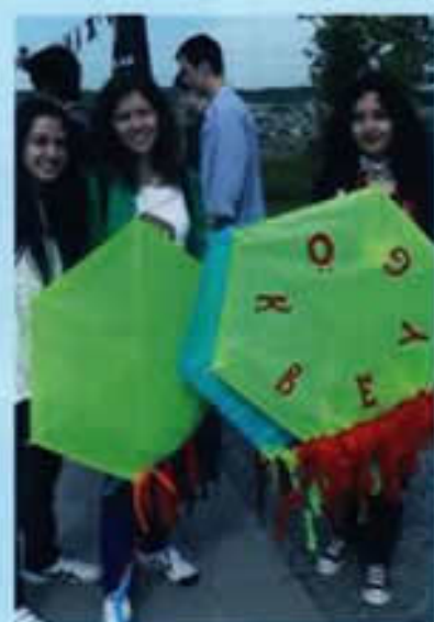
KABATAŞLI KIZ ÖĞRENCİ KARDEŞLERİMİZ DE UÇURTmalarını UÇURDULAR.