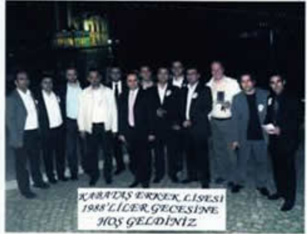
FERİYE LOKANTASININ BAHÇESİNDE 88'LİLERDEN BİR GRUP