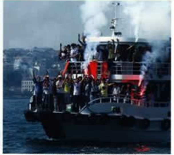
HER YIL OLDUĞU GİBİ İSTEYENLER PİLAVA YİNE DENİZ YOLU İLE GELDİLER.