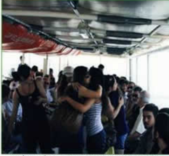
DENİZ YOLU İLE GELENLER DAHA MOTORDA HASRETLİK GİDERMEYE BAŞLADILAR