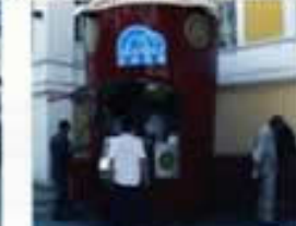
KAHVE DÜNYASI DA 2 YILDIR MOBİL KAHVE İLE KATILYOR