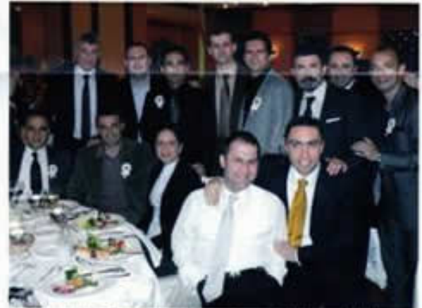
ÖZEL YEMEKLERİNDE 1988 MEZUNLARI HEP BİRLİKTE YİYİP İÇEREK EĞLENDİ VE ANILARDA KALACAK BU FOTOĞRAFTA YER ALDILAR.

Çok güzel bir gece idi. İsim, isim yazmıyoruz. Sadece; onları "...1988'liler" olarak; sevgi ve saygı ile selamlıyoruz.