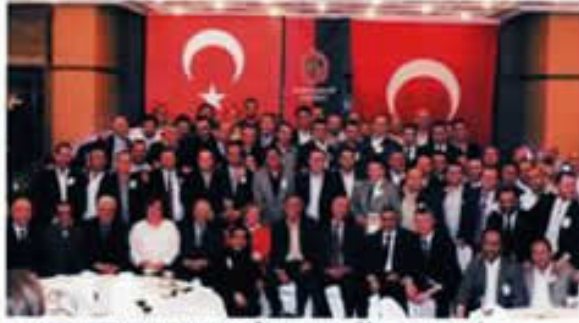
1988 MEZUNLARININ BU ÖZEL YEMEĞİNE KATILABİLENLER TOPLU OLARAK YUKARIDAKİ RESİMDE YER ALDILAR