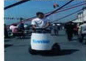
ANA SPONSORUMUZ TTNET REKLAM İÇİN GİNGER GETİRİŞTİ